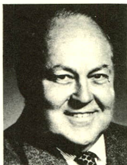
le président du Conseil