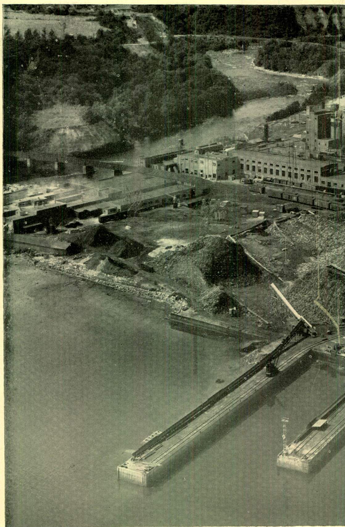
THE DONNACONA MILLS